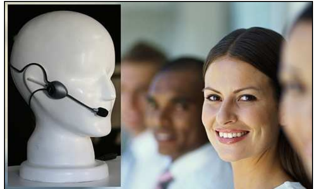
Trageweise / Verwendung im Call Center

Das leichte Nackenbügel-Headset BusinessLine NBS (monaural) ist speziell für professionelle Anwender im Call Center-Bereich entwickelt worden. Das besondere der BusinessLine NB Serie ist die Hörer-Anbindung. Hierbei wird die aus der Hörgeräte-Industrie bekannte Open-Ear-Gain Technologie verwendet.